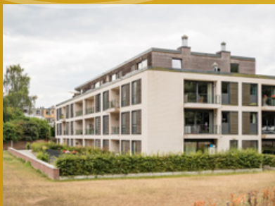
DE VLONDER ASSISTENTIEWONINGEN

De N-VA wil omzichtig omgaan met de aangroei van onze bevolking om de identiteit en de draagkracht van Tervuren niet in het gedrang te brengen. Daarom moeten we de dorpskernen op een verstandige manier verdichten en onze uitgestrekte groene ruimtes vrijwaren. Wij geloven in een verdere modernisering van onze gemeente, maar dan zonder de charme van het landelijke en groene karakter te verliezen. Het lokale woonbeleid moet ervoor zorgen dat het sociale en private woningaanbod in de gemeente voldoende divers is, en moet in het bijzonder aandacht hebben voor de meest behoeftige gezinnen en alleenstaanden.