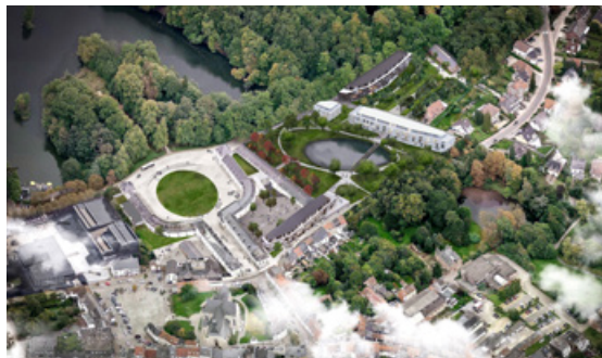
PANQUIN PROJECT LUCHTFOTO