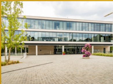
WARANDEPLEIN EN DE ZEVENSTER

Toerisme is een motor van de lokale economie en creëert toegevoegde waarde. De gemeente kan dit in belangrijke mate regisseren door de unieke toeristische troeven van Tervuren te promoten en verder uit te bouwen. Ons rijke cultuurhistorische erfgoed en het fiets- en wandelnetwerk in onze groene gemeente zijn daarin belangrijke parameters. Beleven en genieten staat centraal, in een samenhangend concept met het oog op een gezellig en bruisend Tervuren.