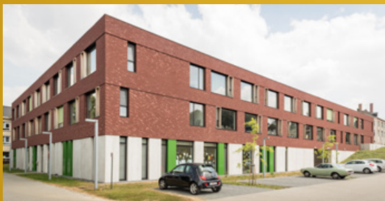
UITBREIDING WOONZORGCENTRUM ZONIËN