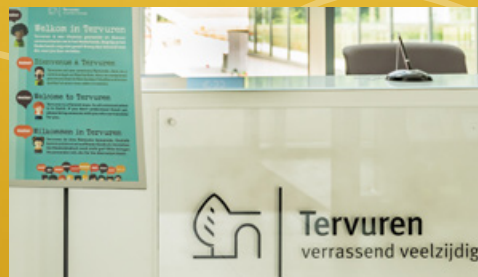
TAALZUIJL AAN HET ONTHAAL ZEVENSTER