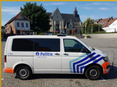
BETERE DIENSTVERLENING EN MEER VEILIGHEID