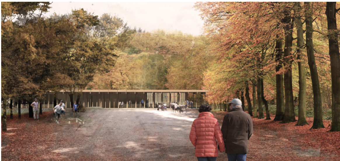
BERG VAN TERMUNT