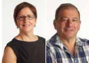
De Kracht van Verandering in Tervuren (p. 2)