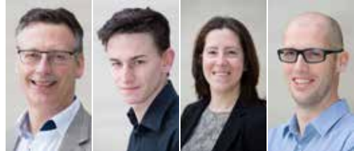
Nieuwkomers op de N-VA-lijst (p. 3)