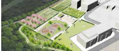
Nieuwe Moestuyn is een pareltje p.2