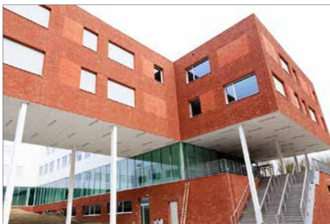
▲ Vanaf 1 september is dit de nieuwe thuis van Gito en CVO.

De leerlingen van het Gito en de cursisten van het CVO zullen het nieuwe schooljaar starten in een nieuw gebouw op de Pater Dupierreuxlaan. Het is een echt pareltje geworden dankzij het tijdloze ontwerp van architectenbureau Stephane Beel.