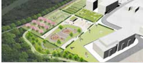
Nieuwe Moestuyn is een pareltje p.2