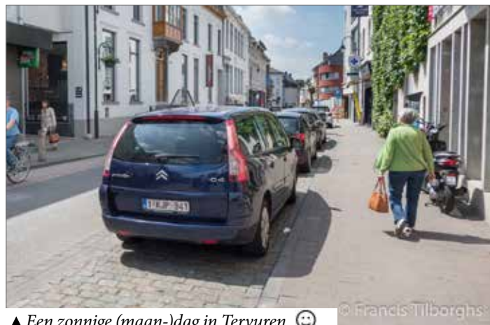
▲ Een zonnige (maan-)dag in Tervuren. 😊

Ook het culturele aspect verwaarlozen we niet. Kunstgalerijen, tentoonstellingsruimtes of creatieve ateliers kunnen