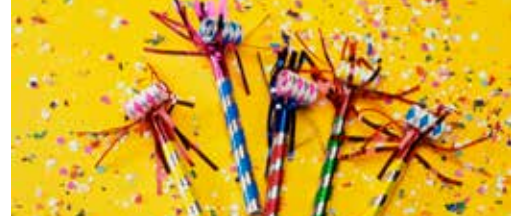
Tervuren feest en nodigt jou uit! p.3