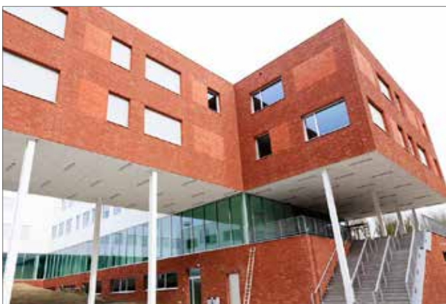
▲ Vanaf 1 september is dit de nieuwe thuis van Gito en CVO.

De leerlingen van het Gito en de cursisten van het CVO zullen het nieuwe schooljaar starten in een nieuw gebouw op de Pater Dupierreuxlaan. Het is een echt pareltje geworden dankzij het tijdloze ontwerp van architectenbureau Stephane Beel.