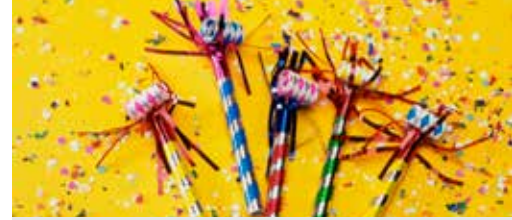
Tervuren feest en nodigt jou uit! p.3