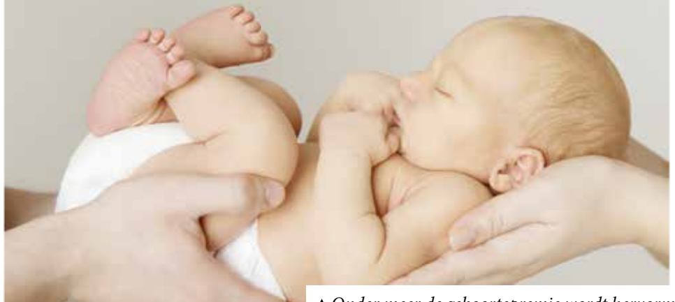
▲ Onder meer de geboortepremie wordt hervormd.

In Tervuren kan je genieten van verschillende sociale premies, zoals toelages aan gezinnen met een kind met een beperking, de geboortepremie en de gratis huisvuilzakken. Niet al deze premies bereiken echter optimaal hun doel, terwijl andere premies waar nood aan is gewoonweg niet bestaan. Daarom evalueert en hervormt een werkgroep momenteel het systeem.