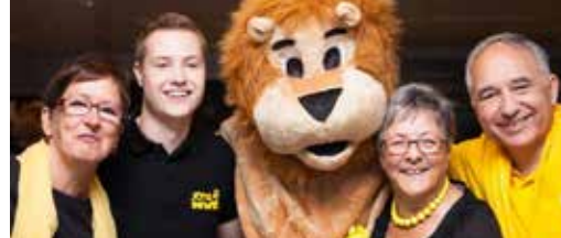
U maakte groot succes van N-VA-eetdag p.3