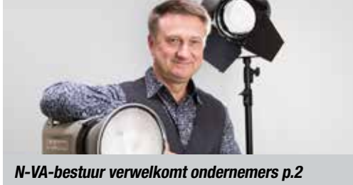
N-VA-bestuur verwelkomt ondernemers p.2