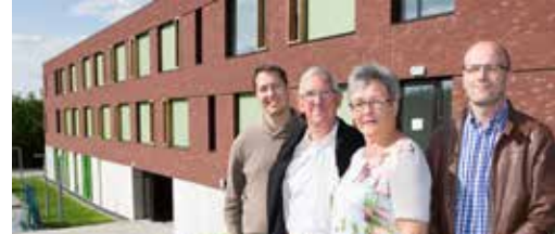
Een hart voor senioren p.3