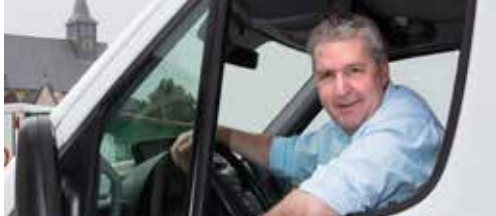
Nederlands, een kwestie van leven of .... p.2